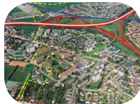
Chasse Royale vu du ciel

former durablement le quartier compte tenu des situations sociales observées mais également de son potentiel en terme de renouvellement urbain. L'objectif premier consiste à améliorer les conditions de vie des habitants et, marquer en profondeur la transformation d'image et de perception des composantes du quartier que peuvent être les logements gérés par V2H ou encore les aménagements urbains et équipements publics créés ou restructurés par la Municipalité.