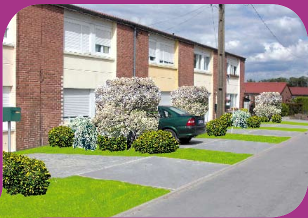
Projet d'aménagement des espaces verts devant les logements réhabilités

Suivront dans la foulée, la réfection de tous « les carins » et l'installation de nouvelles boîtes aux lettres au cas par cas.